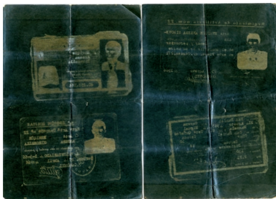
fotocòpia 1966, primera obra on es contempla el negre

sistema cada vegada més decantat cap a una lògica estrictament economicista. Els climes culturals que no responien als requeriments i les exigències de la indústria de l'oci i l'entreteniment tendiren a esvaïr-se, i allò que requeria un esforç intel·lectual o postulava un compromís ètic va ser objecte de tota mena d'estigmatitzacions.