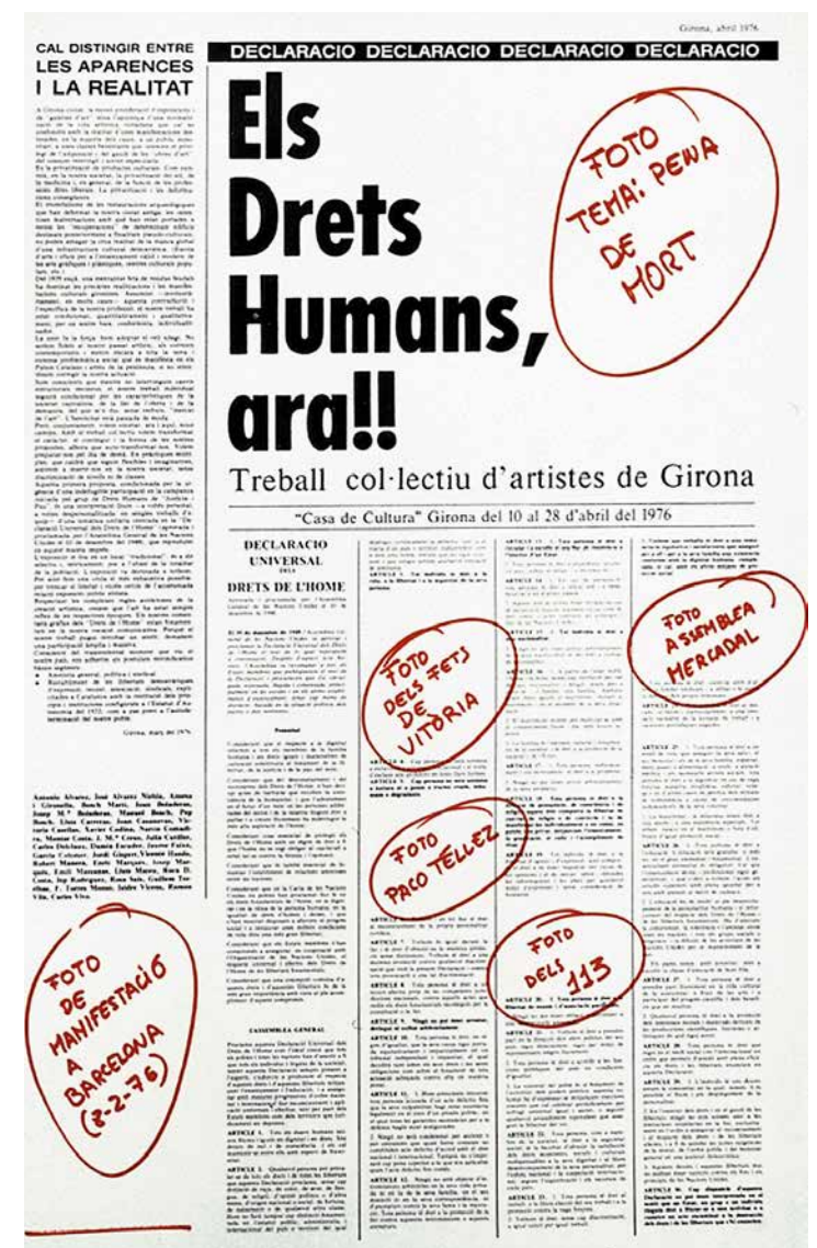
Cartell de l'exposició "Els Drets Humans, ara!!" (1976), que inclou el manifest fundacional de l'ADAG i el nom dels signants.