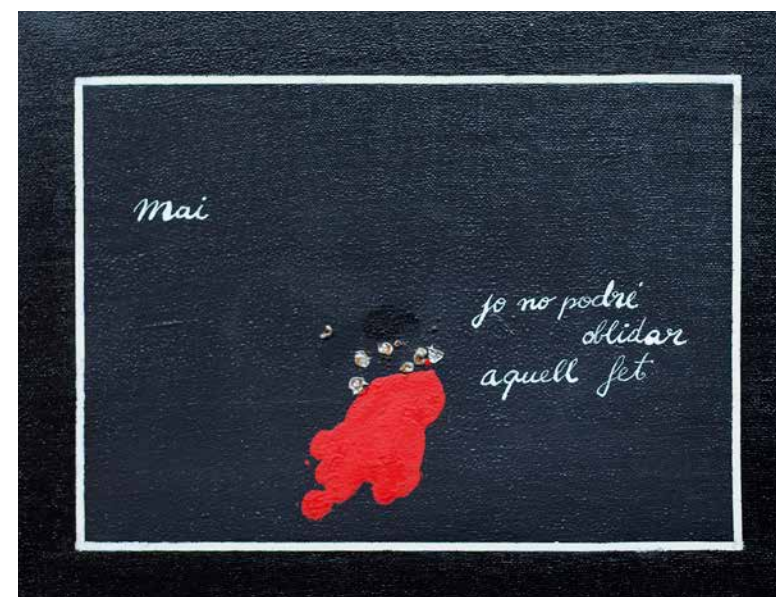
Enric Ansesa Homenatge a Oriol Solé Sugranyes , 1976 Acrílic sobre tela 27 x 35 cm Col·lecció particular