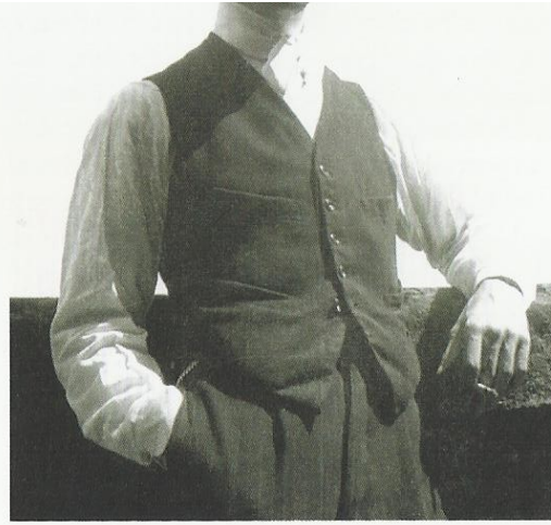
Josep Aragay, en una fotografia dels anys 1920

Algú pot considerar que un autor de la significació històrica d'Aragay mereixia una gran exposició a Barcelona, cosa que no posaré en qüestió, però al meu entendre és positiu que les ciutats mitjanes impulsin una programació ambiciosa i d'alt nivell capaç de captar l'interès de persones d'arreu i de generar un relat propi que incideixi en el discurs general de les arts a Catalunya. I més, quan en tants aspectes la capital del país no exerceix el paper que li tocava jugar i massa sovint resta al marge de la seva realitat més immediata i de les dinàmiques culturals territorials. D'altra banda, aquesta mena d'iniciatives institucionals són fonamentals per alimentar els ecosistemes artístics locals i evitar-ne la periferització, així com per impedir que la cultura de mercat, amb la seva insaciable voracitat, s'ho cruspeixi gairebé tot. La mostra gironina també és útil per recordar-nos l'existència del Museu Josep Aragay de Breda, del qual provenen bona part de les peces exposades, i on cal anar per veure una de les obres més ambicioses i emblemàtiques de l'autor, la titulada Vacances (1923), que no ha estat possible traslladar a Girona per problemes tècnics.