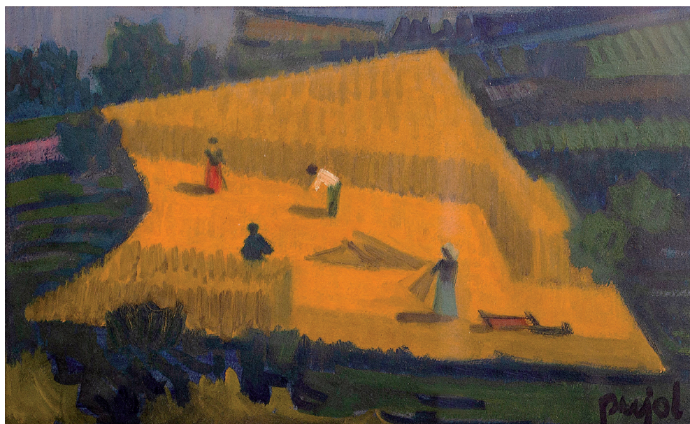
Fig. 12. Josep Pujol, La sega , s. d. Col·lecció Ramon Sala Canadell.