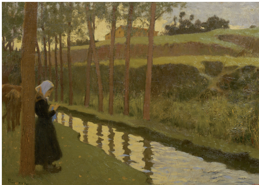
Fig. 3. Joan Llimona, Pasturant , c. 1901. Museu Nacional d'Art de Catalunya.

un tema força documentat i estudiat, de manera que les grans línies diria que estan bastant ben establertes. Ara bé, això no vol dir que no continuï essent un camp obert de recerca, que no hi hagi encara buits per omplir, que no es pugui aprofundir en allò tractat o, en fi, que no sigui possible projectar-hi altres mirades des de nous punts de vista. Cal tenir en compte que l'escriptura de la història és també la història dels diversos presents des d'on es dona forma i sentit al passat, ja que aquesta pràctica, encara que tracti realitats pretèrites, es troba inevitablement vinculada a la contemporaneïtat dels subjectes interpretants, els quals intervenen decisivament en l'afaiçonament i el modelatge del seu objecte d'estudi.