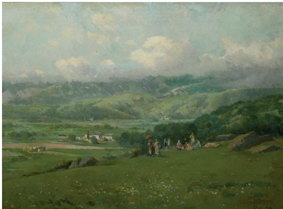
Fig 5. Josep Berga Boix, Paisatge amb figures , 1894. Museu Nacional d'Art de Catalunya.

preludis de vies artístiques futures. 5 Una ruta i unes maneres de fer que, com és sabut, enllaçaven amb el trajecte iniciat més de dues dècades abans per determinats sectors de la pintura francesa —Théodore Rousseau, Jean-François Millet, Charles-François Daubigny, Jean-Baptiste Camille Corot, Jules Breton, etc.— i que també es va manifestar en molts altres països. 6