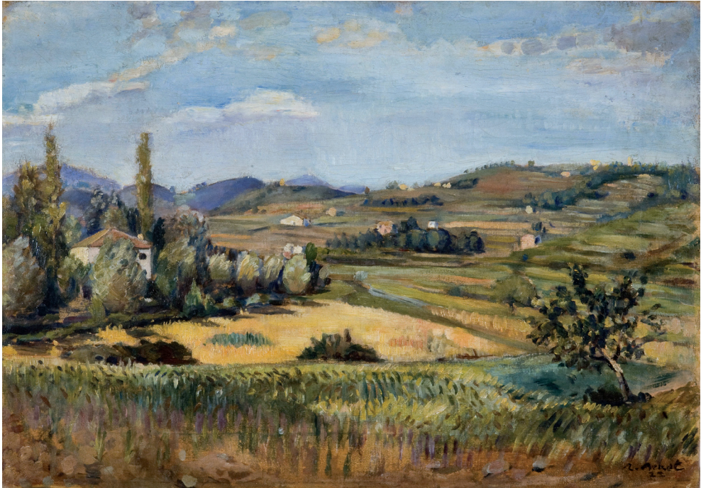
Figura 14. Rafael Benet, Paisatge d'Olot (Batet) , 1922. Museu Nacional d'Art de Catalunya.

defensa d'un particular "naturalisme" entès com una expressió de la idiosincràsia del país, un discurs amb ressons de l'anomenat retorn a l'ordre del període d'entreguerres. Uns anys abans, Rafael Benet ja havia afirmat, en coincidència amb altres crítics, que "l'escola catalana de pintura és, sobretot, una escola de paisatgistes", 50 amb la qual cosa imbricava una idiosincràsia nacional amb un gènere artístic (Fig. 14). Entre els artistes seleccionats per Merli, hi havia nombrosos autors vinculats, en major o menor mesura, al paisatgisme olotí i al seu règim visual, com el mateix Benet, Domènec Carles, Rafael Llimona, Ignasi Mallol o Iu Pascual, entre molts altres. 51