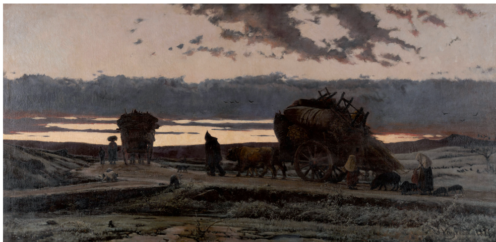
Figura 6. Joaquim Vayreda, Recança , 1876. Museu Nacional d'Art de Catalunya.

El paisatge que veiem representat en la major part de les pintures de l'Escola d'Olot correspon a un locus amoenus on tot sembla seguir assossegadament i impertorbable el seu curs, sense estridències ni desmesures, àdhuc la llum hi sol tenir un caràcter matisat lluny de contrastos accentuats que puguin alterar l'estat de placidesa buscat. Els personatges, quan hi apareixen, tendeixen a integrar-se en un entorn agradable i acollidor (Fig. 5). Però, ni que sigui excepcionalment, el paisatge també esdevé una mena de lament melangiós davant un "arcadisme" ferit, com en les diferents versions del quadre titulat Recança de Joaquim Vayreda (Fig. 6), que suggereixen aspectes d'una crisi camperola que tant ell com el seu germà Marian també tractarien literàriament.