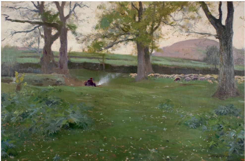
Fig. 2. Joaquim Mir, Voltants d'Olot , c. 1894. Museu Nacional d'Art de Catalunya.

Ultra les iniciatives esmentades hi ha hagut en les darreres dècades moltes altres aportacions historiogràfiques d'interès que han contribuït al coneixement de l'Escola d'Olot, la tria bibliogràfica que apareix al final de l'article en deixa constància fefaent. Tot plegat permet afirmar que, ara com ara, aquella experiència constitueix