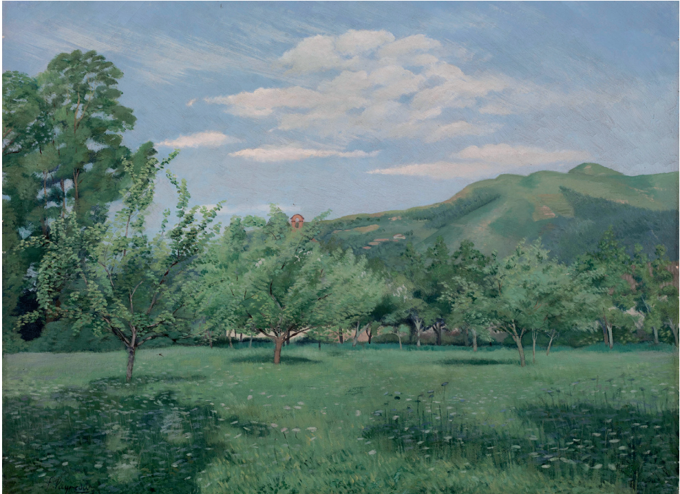
Fig. 7. Francesc Vayreda, Paisatge de primavera , 1923. Museu Nacional d'Art de Catalunya. L'autor va formar part de la Lliga Regionalista fins que l'any 1922 fou un dels promotors de l'escissió que donaria lloc a Acció Catalana.

Rafael Masó, també membre de la Lliga, el disseny de casa seva, una de les obres més emblemàtiques de l'arquitecte noucentista gironí, el qual també remodelà el Mas Riba a la Vall de Bianya de la família Burch Ventós, igualment grans propietaris vinculats al carlisme. Eugeni d'Ors, Josep Carner i altres caps de brot noucentistes formaven part del cercle d'amistats de Masramon i feren estades sovintejades a Olot. I, des de la barcelonina revista Catalunya , dirigida per Carner, es vindicava els Vayreda, el paisatgisme olotí, els certàmens literaris o les exposicions artístiques que se celebraven a la ciutat. 13