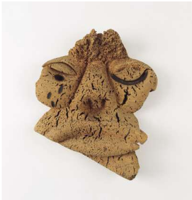
J. Vicens Gironella, I el sol va plorar (entre el 1946 i el 1948). Escultura en suro (Collection de l'Art Brut, Lausana)